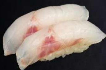
134 NIGIRI SPIGOLA(2PZ) € 3.50