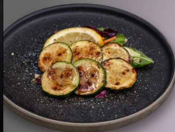
037 SPIEDINI ZUCCHINE € 4.00

*Tutte le immagini sono inserite a scopo illustrativo. I prodotti possono subire modifiche. N.B. I prodotti presenti in menù sono da considerarsi surgelati all'origine. Per prodotti freschi chiedere al personale.