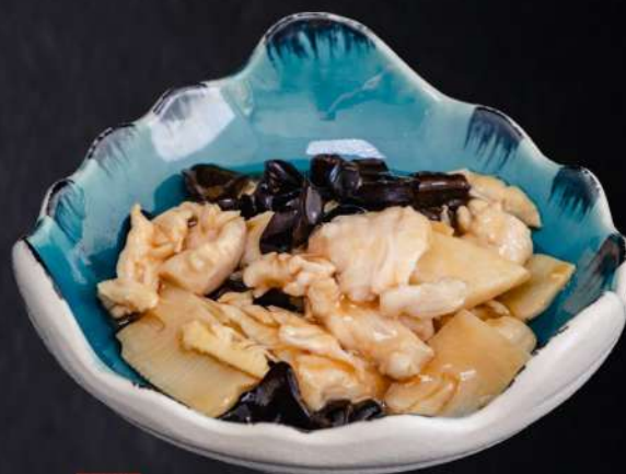
063 POLLO FUNGHI BAMBÙ pollo saltato con funghi e bambù € 7.00