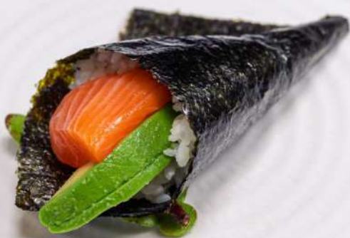
144 TEMAKI SALMONE(1PZ) salmone avocado € 3.00