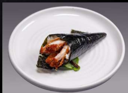
151 TEMAKI POLLO(1PZ) cotolette di pollo fritto € 3.00