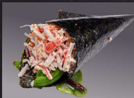
147 TEMAKI CALIFONIA(1PZ) surimi avocado € 3.00