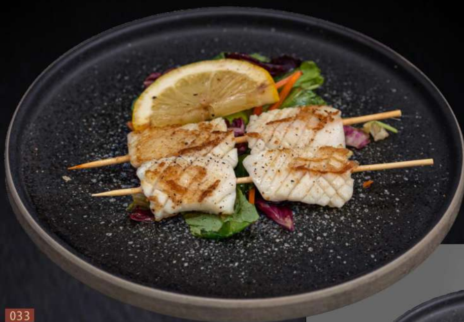
033 SPIEDINI CALAMARI € 5.00