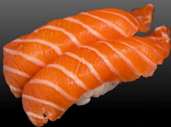
132 NIGIRI SALMONE(2PZ) € 3.50