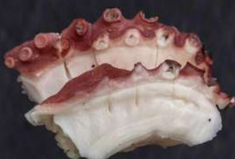
135 NIGIRI POLPO(2PZ) € 3.00