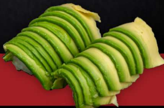
138 NIGIRI AVOCADO(2PZ) € 3.00

*Tutte le immagini sono inserite a scopo illustrativo. I prodotti possono subire modifiche. N.B. I prodotti presenti in menù sono da considerarsi surgelati all'origine. Per prodotti freschi chiedere al personale.