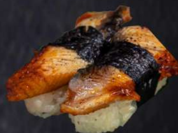
136 NIGIRI ANGUILA(2PZ) € 3.00