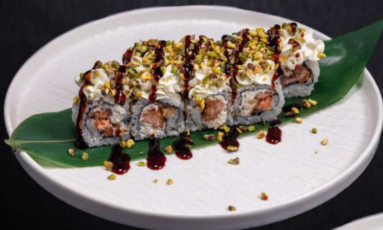
220 FLY PISTACCHIO MAKI(8PZ) salmone fritto e philadelphia pistacchio € 10.00