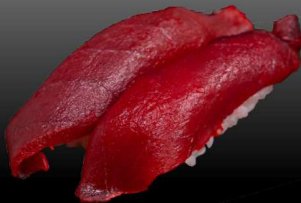
133 NIGIRI TONNO(2PZ) € 3.50