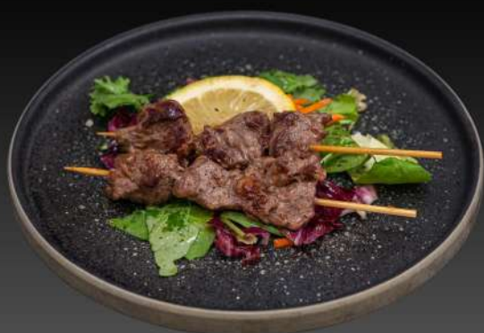
035 SPIEDINI VITELLO € 6.00