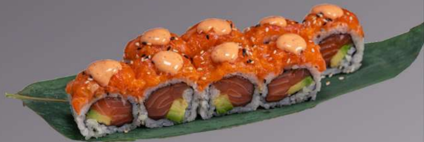
217 SAKE SPICY MAKI(8PZ) salmone avocado e salmone piccante € 12.00