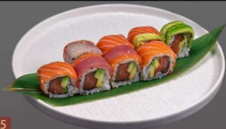
215 SAKE ARCO MAKI(8PZ) salmone avocado e pesce misto sopra € 12.00