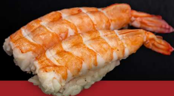
137 NIGIRI GAMBERI COTTO(2PZ) € 3.00