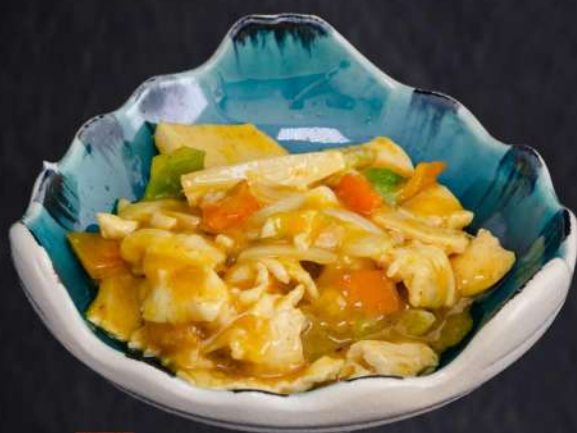
062 POLLO CURRY pollo saltato con verdure e curry € 7.00