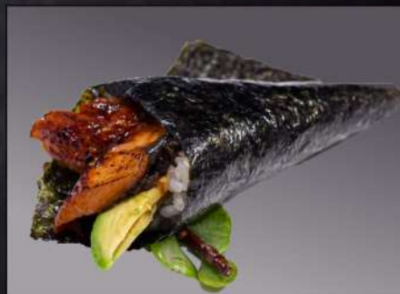
148 TEMAKI ANGUILLA(1PZ) anguilla avocado € 3.00