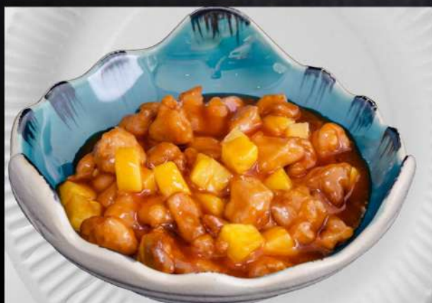
064 POLLO ANANAS pollo saltato con ananas € 7.00