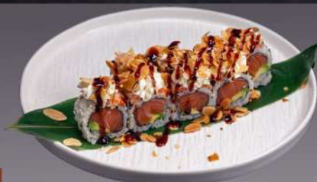
219 SAKE MANDORLE MAKI(8PZ) salmone,avocado,salmone scottato, Philadelphia,mandorle € 12.00