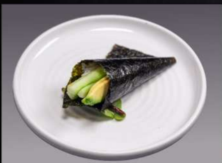
149 TEMAKI YASAI(1PZ) verdure miste € 3.00