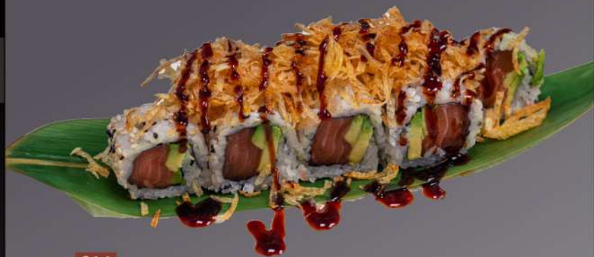
216 SAKE BARI MAKI(8PZ) salmone avocado e patate fritto € 10.00