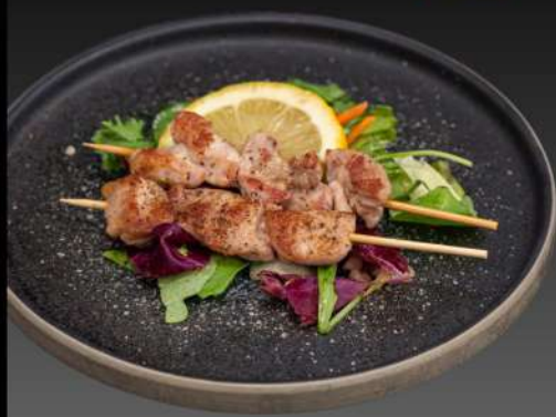
034 SPIEDINI POLLO € 5.00