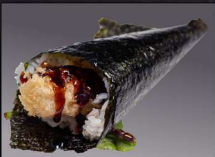
146 TEMAKI TEMPURA(1PZ) tempura di gamberi € 3.00