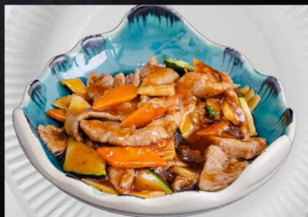
065 VITELLO PEPE NERO vitello saltato con verdure salsa pepe nero € 7.00

*Tutte le immagini sono inserite a scopo illustrativo. I prodotti possono subire modifiche. N.B. I prodotti presenti in menù sono da considerarsi surgelati all'origine. Per prodotti freschi chiedere al personale.