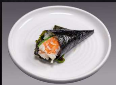
150 TEMAKI GAMBERO COTTO(1PZ) gambero cotto avocado € 3.00