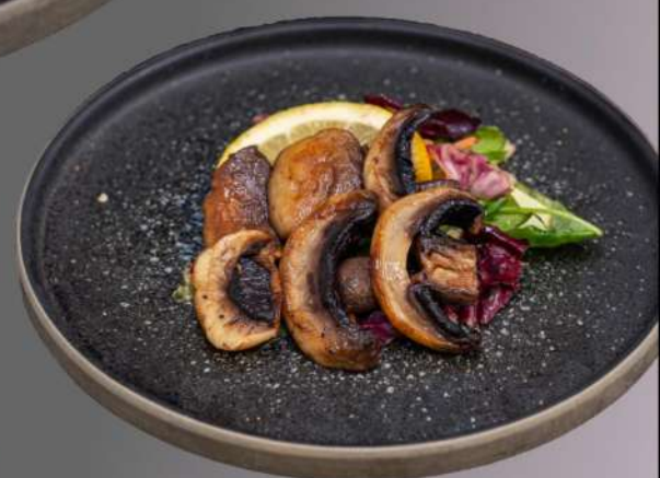
036 SPIEDINI FUNGHI € 4.00