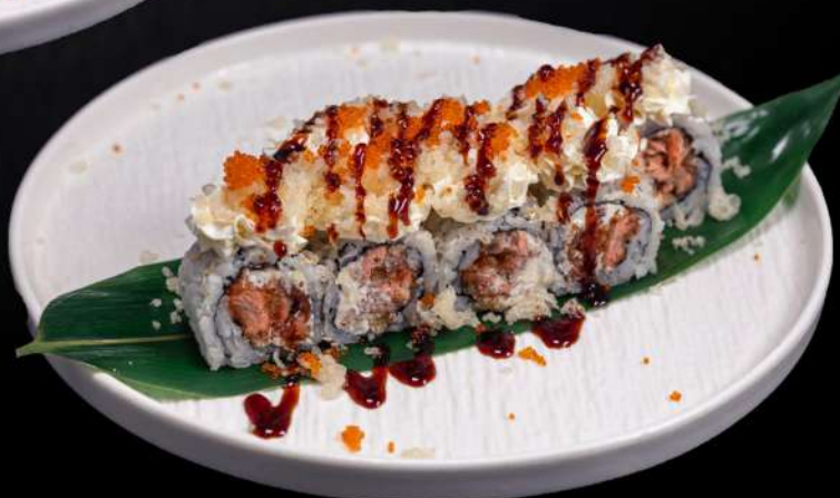
221 FLY JOY MAKI(8PZ) salmone fritto,philadelphia,farina tempura,tobiko € 12.00

*Tutte le immagini sono inserite a scopo illustrativo. I prodotti possono subire modifiche. N.B.I prodotti presenti in menù sono da considerarsi surgelati all'origine. Per prodotti freschi chiedere al personale.