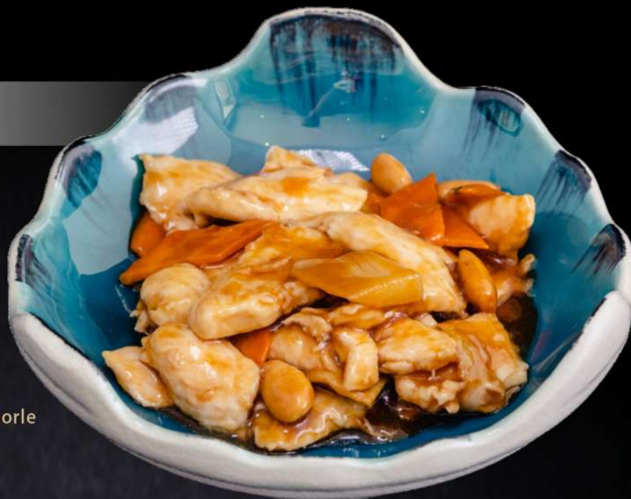
061 POLLO MANDORLE pollo saltato con mandorle € 7.00 🌱